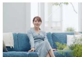
健康状態の自己管理