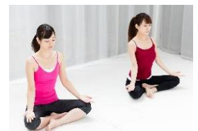
運動時の心拍・呼吸モニタ