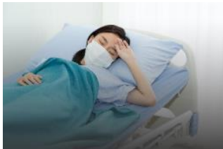
自宅療養者の容態モニタ