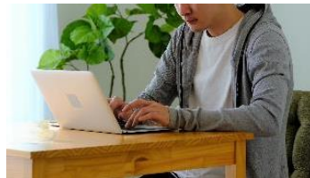
在宅ワーク者の健康管理