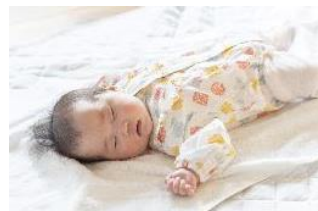
乳幼児の状態モニタ